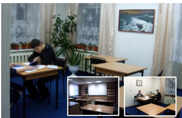
комната для занятий

Для организации досуга в общежитии имеются оборудованные комнаты для занятий, комната для отдыха, спортивная комната (настольного тенниса, комплексные тренажеры), комната воспитателя.