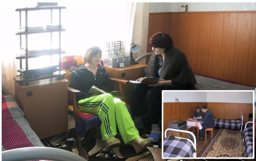
комнаты в студенческом общежитии

В общежитии имеются 3 кухни (площадью по 20 кв.м.). В кухне имеется 2 электроплиты, 2 раковины, разделочные столы.