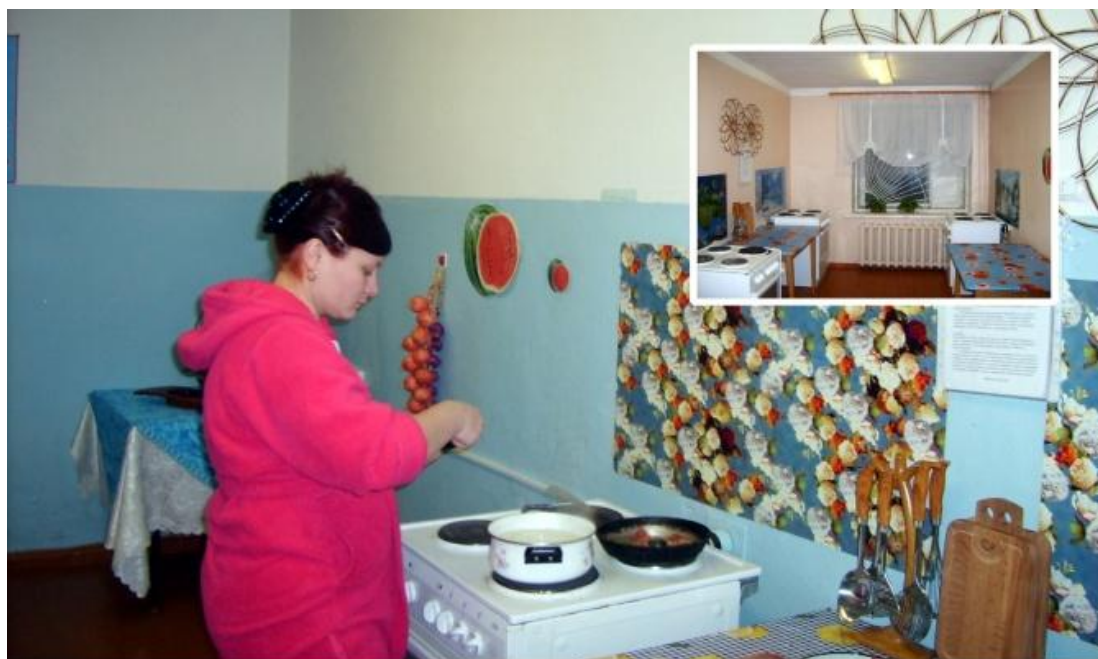
кухня в студенческом общежитии

В общежитии имеются 3 кухни (площадью по 20 кв.м.). В кухне имеется 2 электроплиты, 2 раковины, разделочные столы.