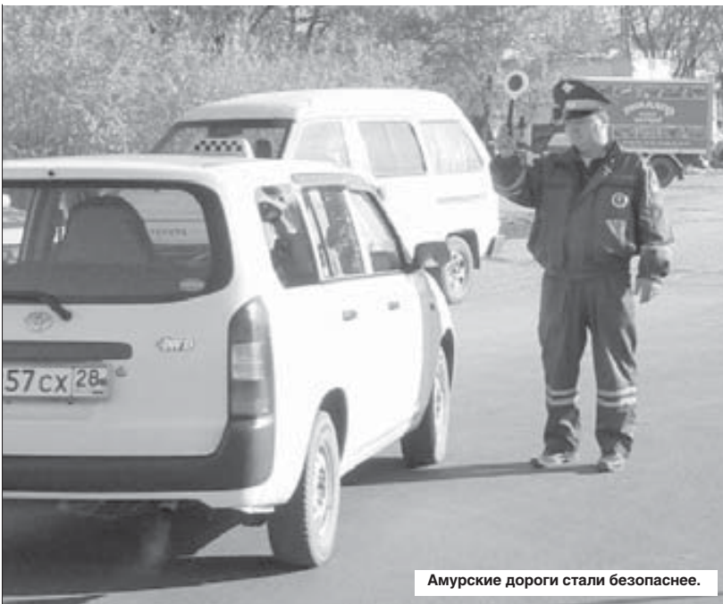
Амурские дороги стали безопаснее.

- Таких, безусловно, хороших результатов удалось добиться благодаря серьезному комплексному подходу властей и управления внутренних