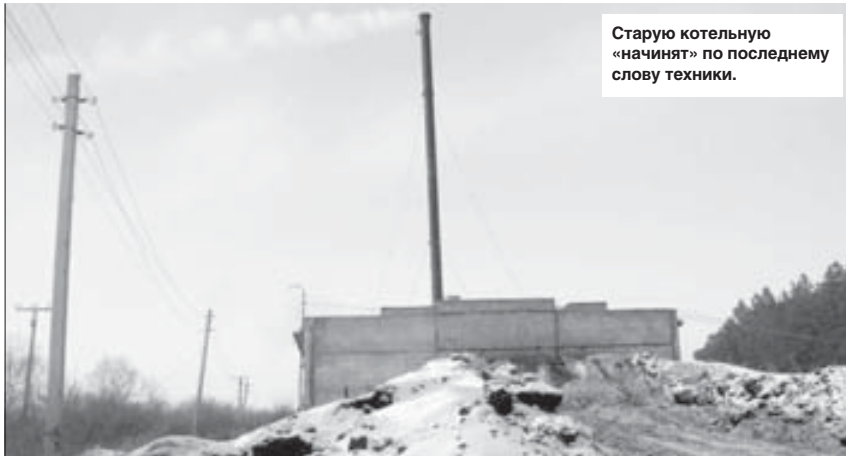
Старую котельную «начинят» по последнему слову техники.

В том же году мы прошли экспертизу, все одобрили, и были готовы приступить к ра-