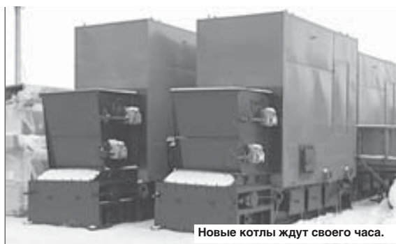
Новые котлы ждут своего часа.