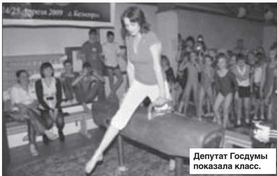
Депутат Госдумы показала класс.

Правда, дать полноценный урок спортсменкам из Белогорска Светлана не смогла. Старый инвентарь не прошел испытания депутатом Госдумы.