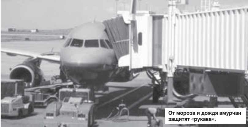
От мороза и дожда амурчан защитят «рукава».

Новый благовещенский аэровокзал должны открыть уже в этом году