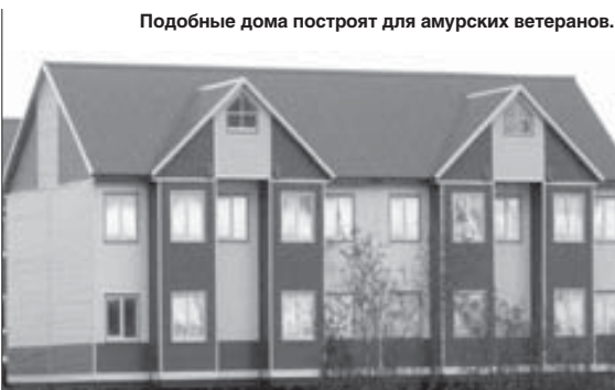
Подобные дома построят для амурских ветеранов.

Единственное приемлемое решение - строительство но-